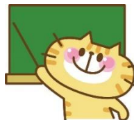
院内がん登録実務者認定資格

県外からの参加者が多いのは、Web講義だったからかな。多数参加していただき、ありがとうございました。